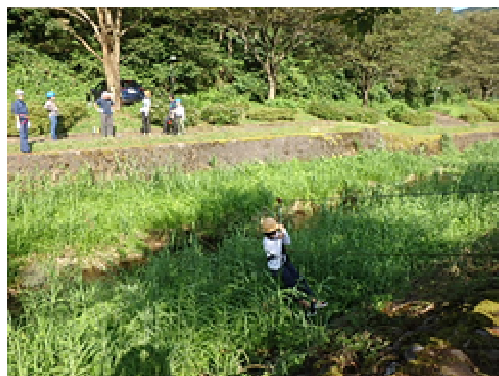
どのように救助されるのか？